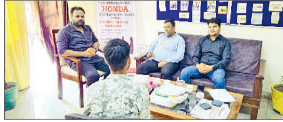
पूंडरी। पूंडरी आईटीआई में बच्चों का साक्षात्कार लेते हुए कंपनी अधिकारी।