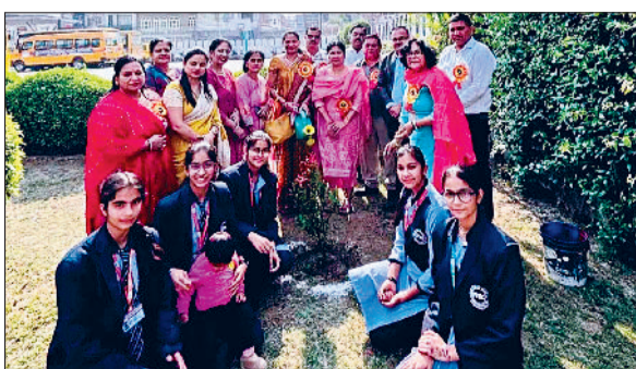
जीद। पौधारोपण करते हुए स्वयंसेवक।

मोतीलाल नेहरू पब्लिक विद्यालय में राष्ट्रीय सेवा योजना (एनएसएस) का विशेष शिविर बड़ी उत्साह और सामाजिक समर्पण की भावना के साथ आयोजित किया गया। इस शिविर का आयोजन युवा मित्र