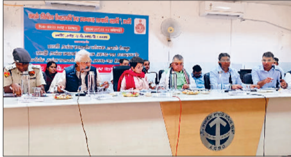
जीद। मीटिंग में मौजूद सांसद व अधिकारी।

जिला विकास समन्वय एवं निगरानी समिति (दिशा) की बैठक मंगलवार को स्थानीय डीआरडीए हॉल में सम्पन्न हुई। जिसकी अध्यक्षता सिरसा लोकसभा क्षेत्र की सांसद कुमारी शैलजा ने की। बैठक में सोनीपत के सांसद सतपाल ब्रह्मचारी तथा हिसार के सांसद जयप्रकाश सह अध्यक्ष के रूप में उपस्थित रहे। बैठक में जिले के विभिन्न विभागों द्वारा प्रस्तुत 21 एजेंडों की प्रगति रिपोर्ट की समीक्षा की गई। सांसदों ने कहा कि विकास योजनाओं को गति, पारदर्शिता और गुणवत्ता के साथ आगे बढ़ाया जाए ताकि योजनाओं का जनहित में अधिकतम प्रभाव सुनिश्चित हो सके। सांसद कुमारी शैलजा ने कहा कि पेयजल, स्वच्छता, सड़क सुरक्षा, स्वास्थ्य, शिक्षा एवं स्वच्छ भारत मिशन जैसे क्षेत्रों में प्रशासन द्वारा कई महत्वपूर्ण कार्य किए जा रहे हैं। साथ ही उन्होंने हाइवे सुरक्षा, आपात सेवाओं की उपलब्धता और कचरा प्रबंधन जैसी जनसुविधाओं को और सुदृढ़ करने की आवश्यकता पर भी बल दिया। उन्होंने अधिकारियों से कहा कि विकास कार्यों की समीक्षा करते समय वर्तमान रिपोर्ट के साथ पूर्व रिकॉर्ड का भी अवलोकन किया