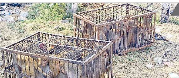
पूंडरी। पूंडरी से पकड़े गए बंदरों को जंगल में छोड़ने के लिए ले जाते हुए।

बच्चों, महिलाओं और बुजुर्गों के लिए घरों से निकलना भी जोखिम भरा हो गया था। कई बार बंदरों के काटने, भोजन छीनने और घरों में