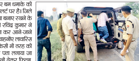
जौड़। पोली गांव के पास वाहनों की जांच करते गुलाना पुलिस।