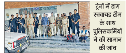
ट्रेनों में डोग स्क्वाड टीम के साथ पुलिसकर्मियों ने की सामान की जांच

जौड़। दिल्ली में सोमवार देर शाम लाल किला के पास एक कार में हुए धमाके के बाद रेलवे जंक्शन पर जीआरपी व आरपीएफ कर्मियों ने संयुक्त रूप से सर्च अभियान चलाया। सोमवार रात को नौ बजे के बाद जौड़ जंक्शन पर आने वाले ट्रेनों में डोग स्क्वाड टीम के साथ पुलिसकर्मियों ने जांच अभियान चलाया। रात को बीकानेर स्पेशल एक्सप्रेस, पंजाब मेल, धोलाधार एक्सप्रेस, गांधीनगर कैपिटल एक्सप्रेस में यात्रियों के सामान की जांच की गई। इसके अलावा मंगलवार को हिमसागर, गंगानगर एक्सप्रेस, जौड़-रोहतक पैसेंजर व जौड़-दिल्ली डीएमयू ट्रेनों में भी पुलिसकर्मियों ने संदिग्ध व्यक्तियों की पकड़ के लिए जांच अभियान जारी रखा। रेलवे जंक्शन परिसर में कमांडो टीम ने जांच के दौरान एक यात्री से पूछताछ कि वह कहाँ से कहाँ आया है और कहाँ जाना है। इसके बाद उसके बैग की मेटल डिटेक्टर से जांच की। इसके अलावा बस