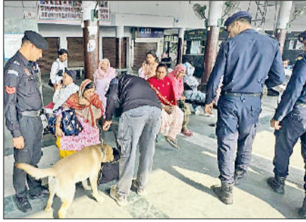
कैथल। कैथल में सार्वजनिक स्थलों पर जांच करते पुलिस कर्मचारी