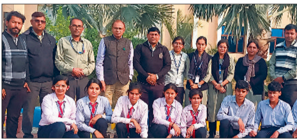
विज्ञान मंडल प्रतियोगिता में विजेता टीम के प्रतिभागी।

उन्होंने विद्यार्थियों को संबोधित करते हुए पत्रकारिता में रिपोर्टिंग की भूमिका, समाचार लेखन की तकनीक तथा न्यूज वैल्यू के