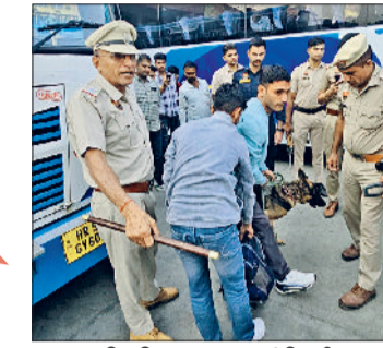
हरिभूमि न्यूज नई दिल्ली

दिल्ली में बम धमाके के चलते अलर्ट पर चल रही पुलिस ने स्वेट टीम, स्नीफर डोग व अन्य संसाधनों से लैस होकर बस अड्डा, रेलवे स्टेशन, बाजार में सघन सर्च अभियान चलाया। सर्च अभियान के दौरान संदिग्ध नहीं मिला। स्टेट तथा नेशनल हाईवे पर चौकसी को कड़ा कर दिया गया है। पुलिस टीमों ने लोगों से अपील की कि संदिग्ध व्यक्ति या वस्तु दिखाई देने पर तुरंत पुलिस को सूचना दें। दिल्ली बम धमाके के बाद से अलर्ट पर चल रही जिला पुलिस ने अपने अपने इलाकों में सर्च अभियान चलाया। जिसमें थाना प्रभारी के अलावा चौकी प्रभारी पुलिस बल के साथ अपने अपने इलाकों में अभियान में शामिल हुए। विशेष कर नेशनल तथा स्टेट हाईवे पर कड़ी चौकसी को रखा गया। नाके लगाकर वाहन की तलाशी ली गई और उनके दस्तावेज जांचने के बाद उसमें सवार लोगो से भी पूछताछ की गई।