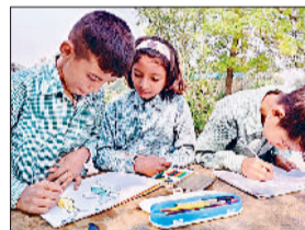
कार्यक्रम में भाग लेते हुए बच्चे।

राजकीय माध्यमिक विद्यालय बरसाना में राष्ट्रीय शिक्षा दिवस बड़े हर्षोल्लास के साथ मनाया गया। इस अवसर पर विद्यालय परिसर में शिक्षकों और विद्यार्थियों की उपस्थिति में विभिन्न शैक्षणिक एवं सांस्कृतिक प्रतियोगिताओं का आयोजन किया गया। कार्यक्रम का उद्देश्य विद्यार्थियों में रचनात्मकता, अभिव्यक्ति और शिक्षा के प्रति जागरूकता को बढ़ावा देना रहा। कार्यक्रम का शुरुआत विद्यालय के