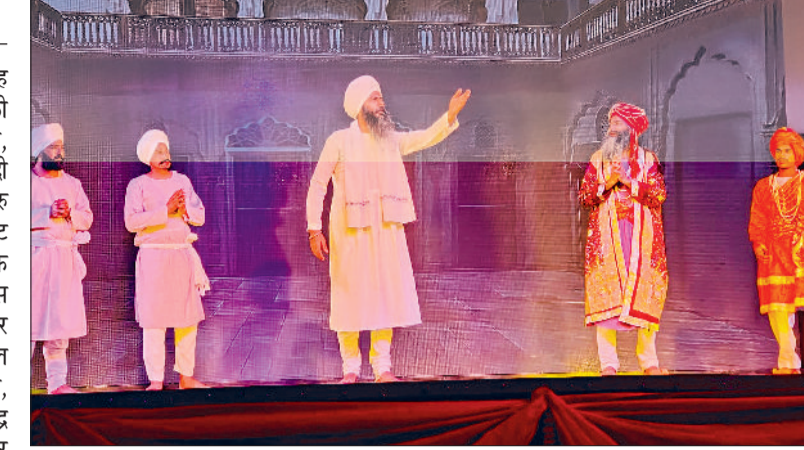
जीद। कार्यक्रम प्रस्तुत करते कलाकार।