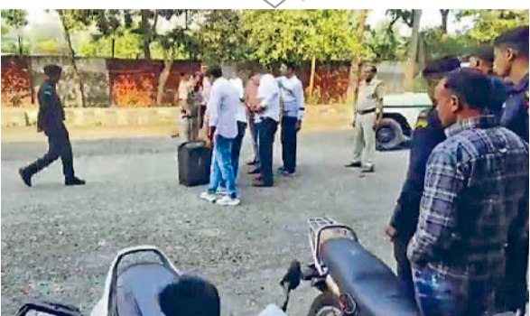
कैथल। बस स्टैंड पर मिले लावारिस सूटकेस को साइड में ले जाकर जांच करते पुलिस कर्मचारी तेल प्रोसेस संयंत्र।

पुलिस छावनी में तबदील हुआ बस स्टैंड, बम होने की अफवाह से थमी सांसें, सूटकेस से निकले कपड़े